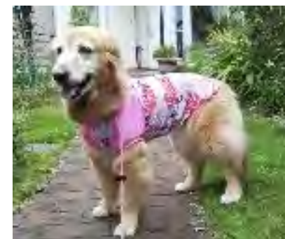
ラッシュガード着用

当店店主が完全オリジナルで考案した製図方法により制作しているため、 このパターンは 当店でしかご購入いただけないもの となっております。